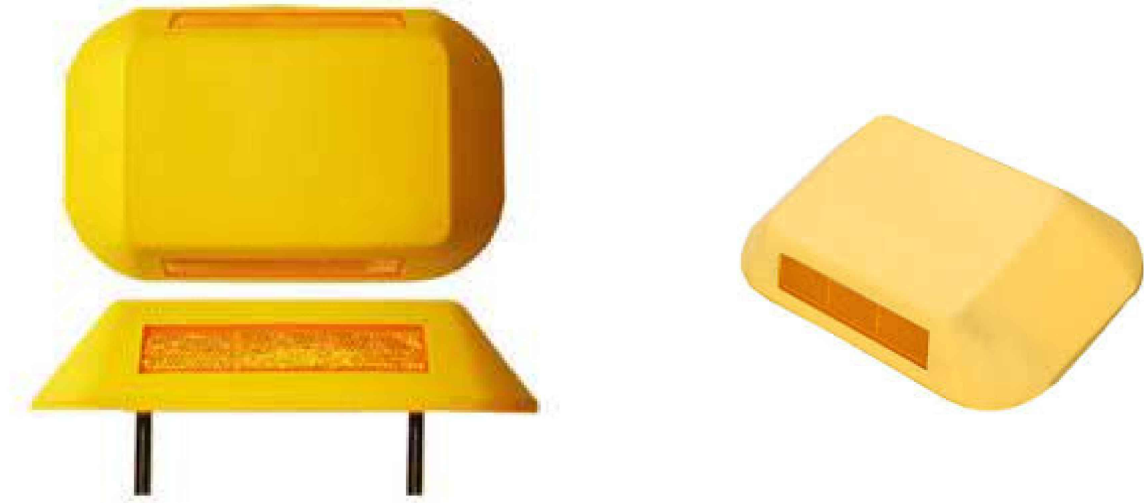
IMAGEM TACHÃO REFLETIVO MONODIRECIONAL SEM ESCALA